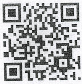
ควาน์โหลดข้อมูลค่าไฟฟ้าค้างชำระ