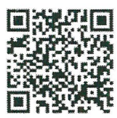
การวิเคราะห์ภาระงาน

การเจ้าหน้าที่ เลขที่รับ..... ๕๕๐ วันที่..... ๑๕ ก.ค. ๒๕๖๖ เวลา..... ๑๔.๐๓