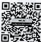
เอกสารที่เกี่ยวข้อง