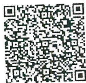
แบบรายงาน