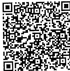
แบบฟอร์มการตอบ ประเมินตอบข้อ OIT