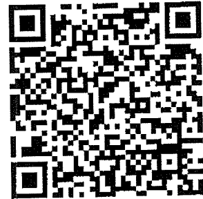
คู่มือเอกสารการ ประเมินฯ ๒๐๒๒