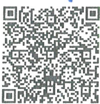
แบบรายงานแผนป้องกัน