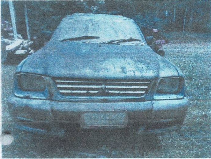
ภาพถ่ายรถยนต์ของกลางในคดีอาญาที่ ๓๙๔/๒๕๖๐