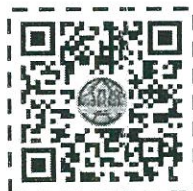
แบบฟอร์มการคัดเลือก “แสงดาว”