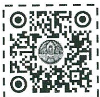
คู่มือการคัดเลือก “แสงดาว”