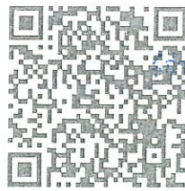
QR-ดาวโหลดข้อมูล

นักวิชาการป่าไม้ชำนาญการ รักษาราชการแทน ราชการสำนักจัดการทรัพยากรป่าไม้ที่ ๑๓ (สงขลา)